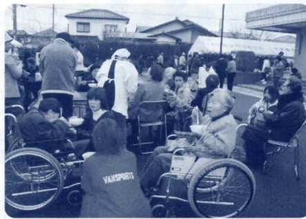
おいしそうに食べるね、おいしかった? (ふれあいまつり模擬店)