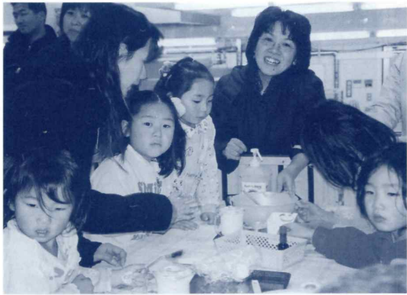
アイスクリーム上手に出来たのかな？

文学教室 我が教室は十人ほどの和氣藹藹グループです。明治の文豪夏目漱石や森鴎外の作品を読んで六年、今年は五千円札でお馴染みの樋口一葉の作品に挑戦しています。少し難しい語句もありますが、なかなか興味深く楽しい世界です。