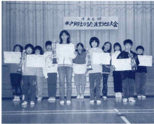
優勝・準優勝チーム、おめでとう

今年のかるた大会は、小学生最後なので、いつもより真剣でした。大会前の練習は六回あり、ベストコンディションで当日をむかえました。 一枚一枚のかるたに神経を集中させ一戦一戦、精一杯がんばりました。予選リーグは、練習の成果もでて三勝し、決勝トーナメントでは、どんどん勝ち進み、みごと優勝することができ、とてもうれしかったです。