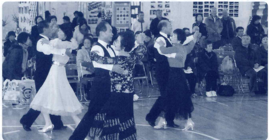
呼吸がピッタリ合ってますね。(社交ダンスクラブ)