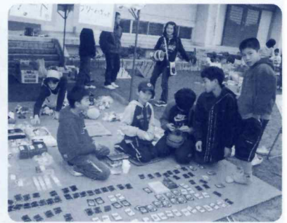
なんのカード? たくさんうれた? (子ども会フリーマーケット)