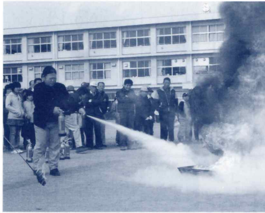
消火器による初期消火

各地より、会場までの避難訓練に始まり、市消防の指導により消火器による初期消火の訓練、救急法の講習会、煙体験等、参加者の手で体験することが出来ました。 災害に欠かすことの出来ない非常食コーナーでは、婦人防災クラブの方々の手で準備されたとん汁に舌鼓