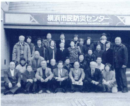
センター前記念写真

をうちながらいただくことが出来ました。 災害は忘れた頃にくるといふ「たとえ」の通り、災害には訓練を通して、心の備えをしたいものです。