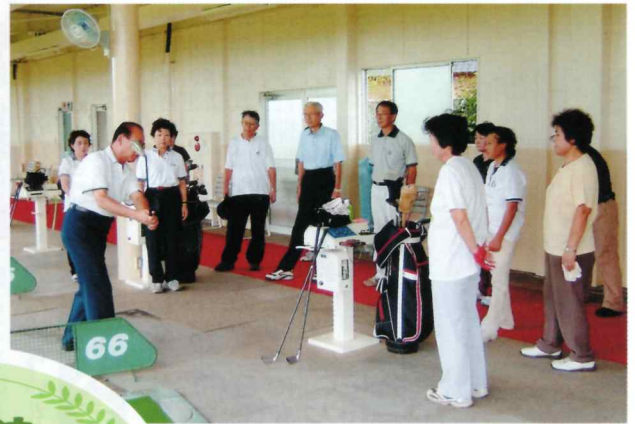
指導よろしく、ゴルフレッスン