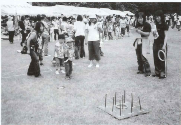
ガンバレ! 今度はうまくいくよ