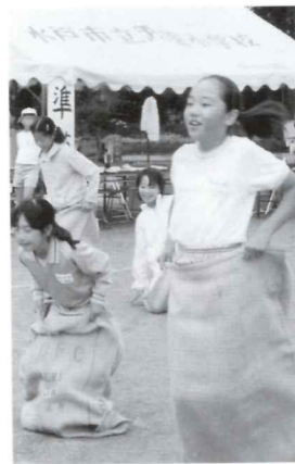
ホップ・ステップ・ジャンプ

雨も小康状態になったので、皆で校庭の整備設営に取り掛かる。スポンジで泥水を吸い取り、バケツに絞る人。スコップで水の流れる道を作る人。ダンプカーの砂を走路に撒く人。老若男女一丸となって、市民運動会を成功させようと、必死で作業に取り組んだ。