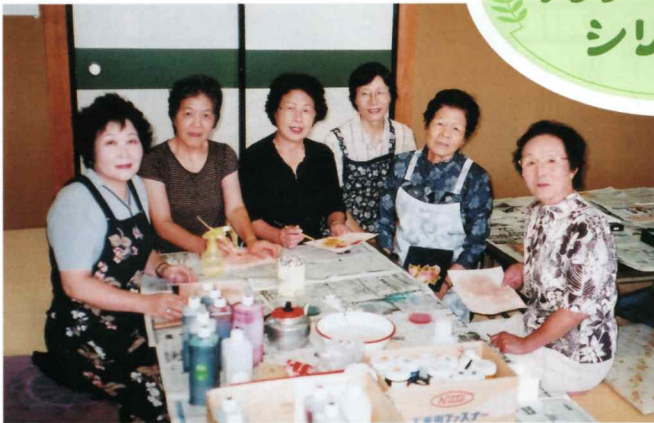
手におかけた作品を見る

ト。山登りやボール探しもし ばしば。これも健康づくり のためと楽しんでおります。