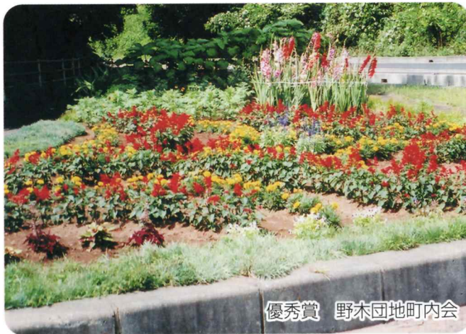
優秀賞 野木団地町内会