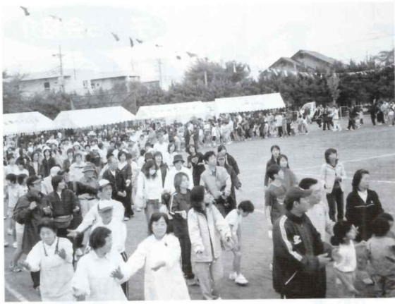
渡里地域の皆さんです

朝六時、実施を知らせる花火が打ち上げられた。定刻に係の皆さんが集まるも雨はまだ止まず。実施を決定した以上ただ天気の回復を待つのみとなった。