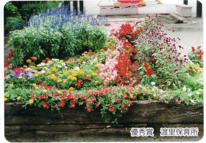
優秀賞 渡里保育所