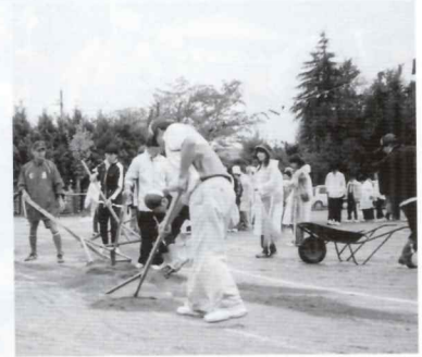
お父さん、ごころうさま

朝六時、実施を知らせる花火が打ち上げられた。定刻に係の皆さんが集まるも雨はまだ止まず。実施を決定した以上ただ天気の回復を待つのみとなった。