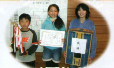
Bブロック優勝(4~6年生) カルタレンジャーV(台四区)※中央大会三位