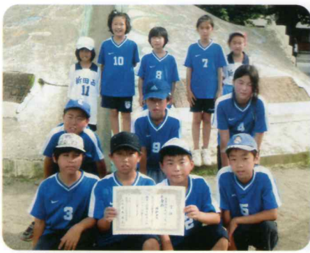
ドッジボール大会 準優勝!