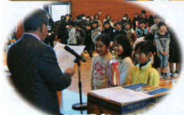
Aブロック優勝(1~3年生) 強気★ガールズ(堀中央)