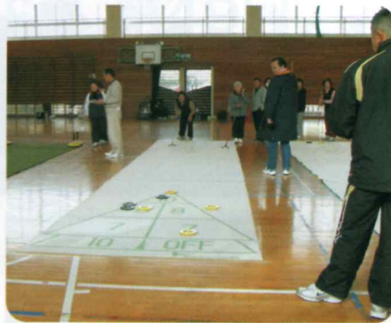
シャッフルボード