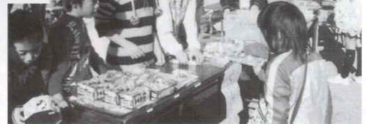
子ども会によるフリーマーケット