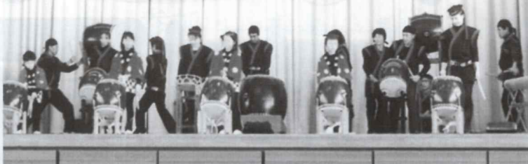
渡里ふれあい太鼓▶