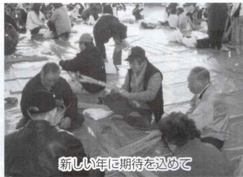
新しい年に期待を込めて

今年度も多くの皆様のご 参加をいただき、しめ飾り づくりが開催されました。 しめ飾りは、新年の厄除 けのために飾られるもので 地区の子ども達に、日本 のお正月の伝統を伝える良 機会となったと思います。