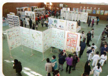
市民センター各教室展示にたくさんの人

ステージでは、五中吹奏楽の演奏・歌謡クラブ発表・ロボットチアリーダー演技・おやじバンド演奏が行われ。一方、体育館内では小学校金管バンドの演奏に始まり、児童絵画・各教室の展示に加え茨城大学生による「ワークシヨップ」、社会福祉協議会有志によるバルーンアートが行われ、子どもたちに人気のコーナーとなりました。多くの方のご協力に感謝申し上げます。