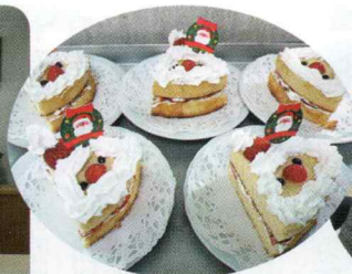
かわいいサンタケーキ