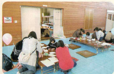
ワークショップ (ふれあい渡里まつり)