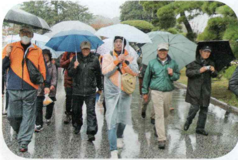
雨の中でもたのしそう!

11月23日(土)、雨の降る中初めてバスを利用して行われました。 最初は皇居へ、年号が令和へ変わり、数日前に大嘗祭が執り行なわれた大嘗官を参観、ここで儀式が行なわれたと思うと、深く心に感じました。 次はオリンピックコミュニケーションや写真等多くの展示物や体験でブースを見学。感動、関心、懐かしく思いました。見学後、各々思いの場所へ、楽しい時を過ごさへ。 全員無事に帰る事が出来て良かったです。 お疲れ様でした。