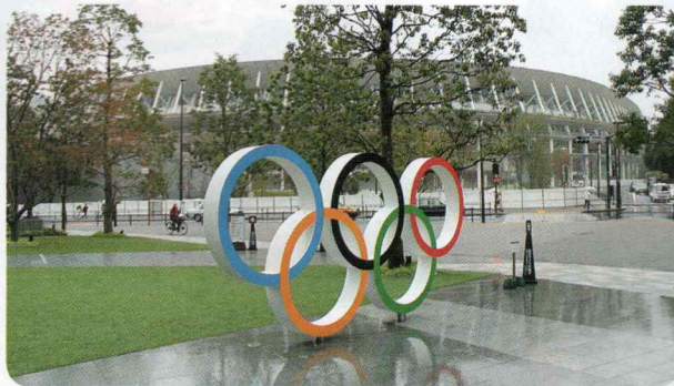
オリンピックスタジアム