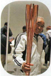
いたずら? 本当はトーチ握ってません

11月23日(土)、雨の降る中初めてバスを利用して行われました。 最初は皇居へ、年号が令和へ変わり、数日前に大嘗祭が執り行なわれた大嘗官を参観、ここで儀式が行なわれたと思うと、深く心に感じました。 次はオリンピックコミュニケーションや写真等多くの展示物や体験でブースを見学。感動、関心、懐かしく思いました。見学後、各々思いの場所へ、楽しい時を過ごさへ。 全員無事に帰る事が出来て良かったです。 お疲れ様でした。