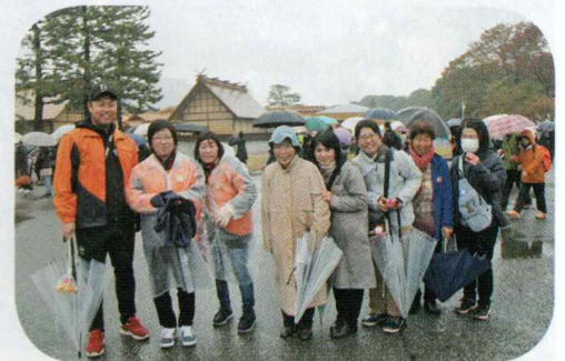
楽しかった歩く会