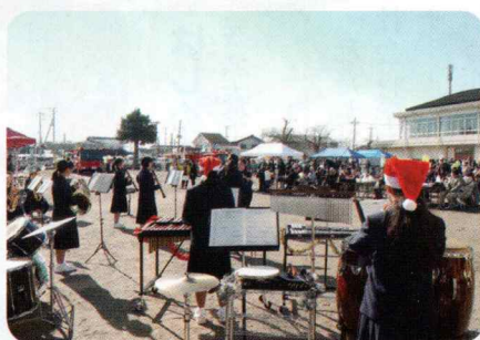
みごとに五中吹奏楽演奏