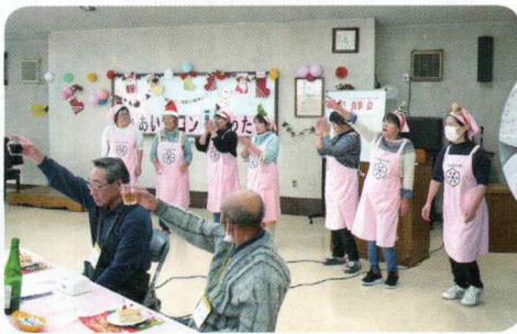
食推員の皆さんごくろうさまでした

食生活改善推進員渡里支部では、社協の会長さんからの依頼で、年1回ですが「ふれあいサロン」に参加するひとり暮らしの方々へのお食事作りをさせていただいています。 今年度は12月21日でクリスマスに近いことから推進員が集まり、参加する方々が少しでもその気分になれるような料理をと考え、「鶏肉の香草焼き」をメインに他5点にケーキとシヤンメリーに決め、前日から準備（ホールの飾り付け）等もし、当日をむかえ、民生委員の方々にも配膳のお手伝いをいただき、無事に終了することが出来ました。 帰りには「おいしかった」