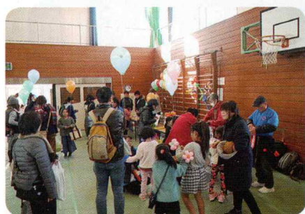
バルーンアートの前は大にぎわい