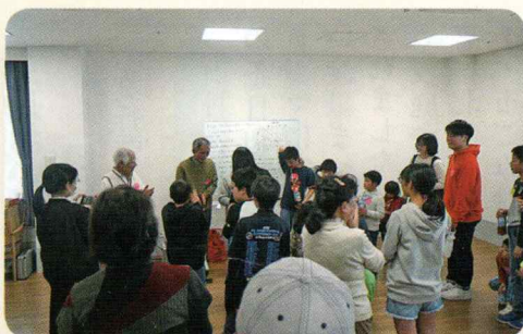
第1回すまいる広がるまちづくりサロン