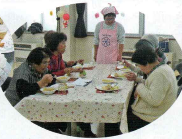
お味はいかがですか？