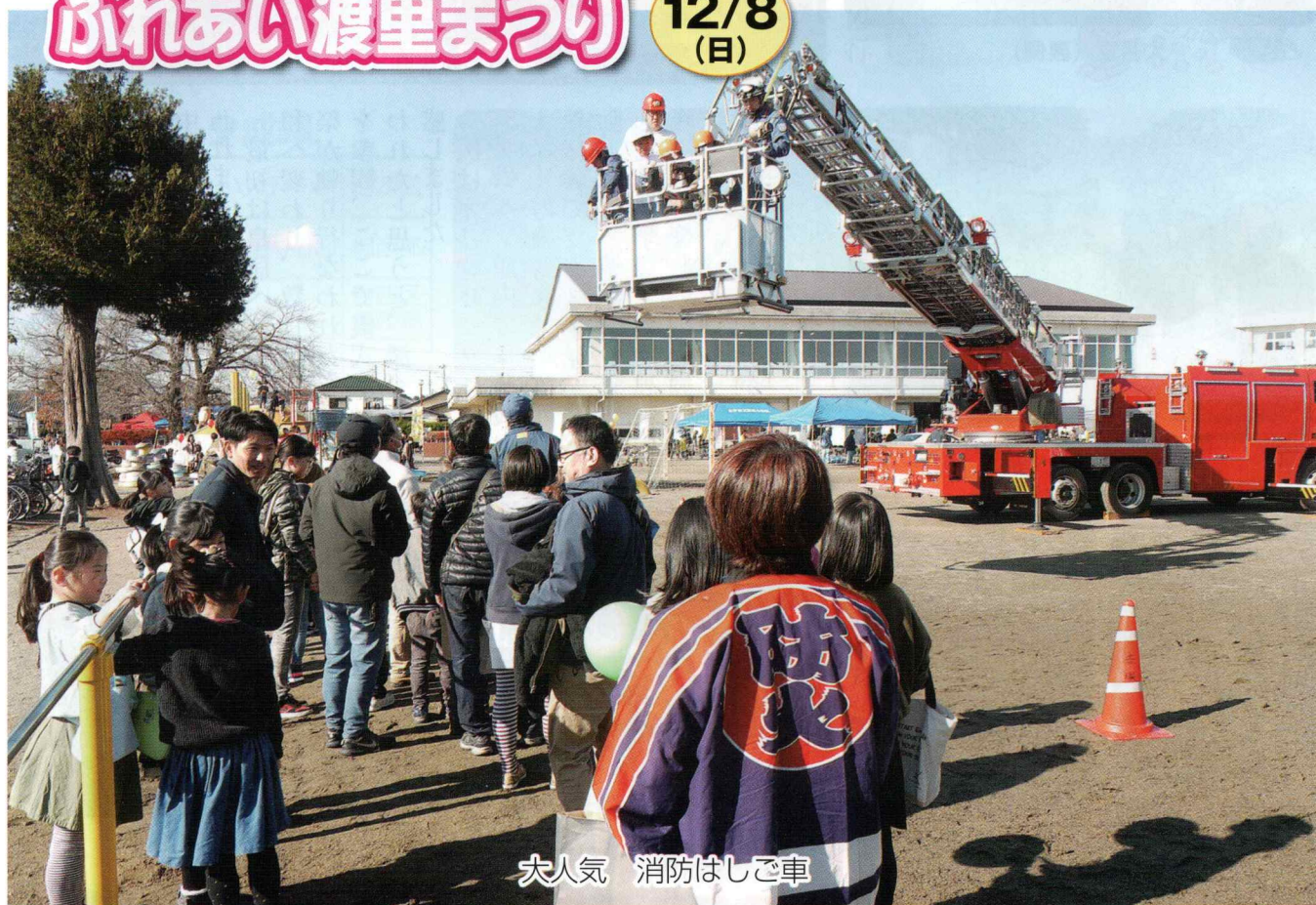
大人気 消防はしご車