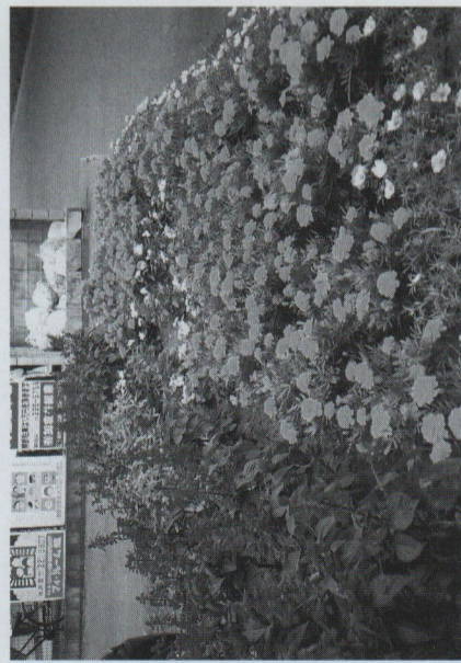
環女性会花壇 (花壇コンクール優秀賞)