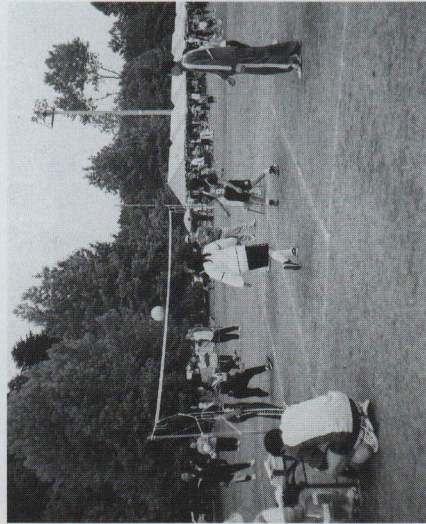
ソフトボール大会